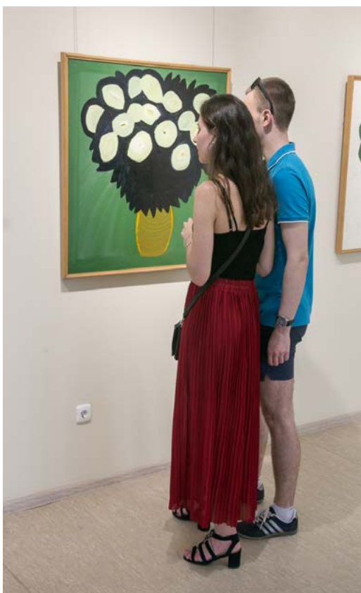
Фото 15. На выставке «Матисс. Поздеев. Цветы». Экспозиционно-выставочный зал Культурно-исторического центра

Андрея Поздеева», прошедшая в рамках праздника «Сибирский первоцвет». На выставке были представлены произведения искусства известных художников: французского художника Анри Матисса и красноярского художника Андрея Геннадьевича Поздеева. Общественная организация «Фонд Андрея Поздеева» многие годы активно сотрудничает с учреждениями культуры на территории Красноярского края как на контрактной, так и на безвозмездной основе.