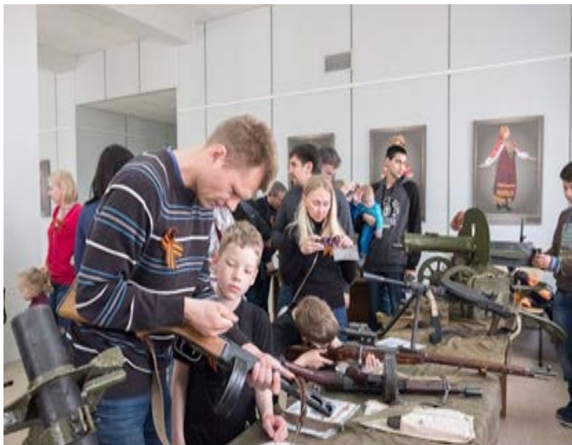
Фото 18. Интерактивная локация «Вооружение Красной Армии». День открытых дверей в Культурно-историческом центре

война», «Вторая мировая война». Каждый посетитель смог сделать памятную фотографию, ознакомиться с униформой и вооружением русской армии различных исторических периодов.