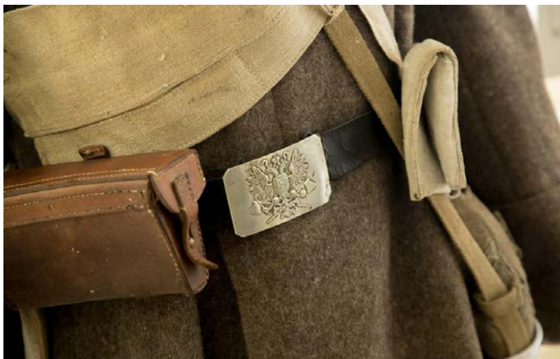
Фото 13. Подлинные предметы снаряжения пехотинца Русской Императорской Армии периода 1914—1918 гг. на выставке «Забывтая война — Брусиловский прорыв» (из частной коллекции членов Красноярского общества любителей военной истории). Экспозиционно-выставочный зал Культурно-исторического центра

сии в Первой мировой войне 1914—1918 гг. Благодаря активному содействию членов Красноярского общества любителей военной истории были представлены уникальные как для г. Красноярска, так и для всего сибирского региона материалы — исторические артефакты, документы, почтовые открытки, авиамодели. Хронике тех лет помогли восстановить личные вещи участников войны и военные трофеи, униформа и снаряжение Русской императорской армии периода Первой мировой войны. Все исторические артефакты являлись личной собственностью членов Красноярского общества любителей военной истории и представлялись широкой публике впервые.