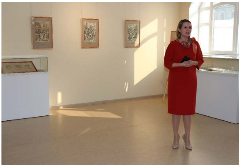
Фото 16. Торжественное открытие выставки факсимильной графики «Альбрехт Дюрер». Экспозиционно-выставочный зал Культурно-исторического центра