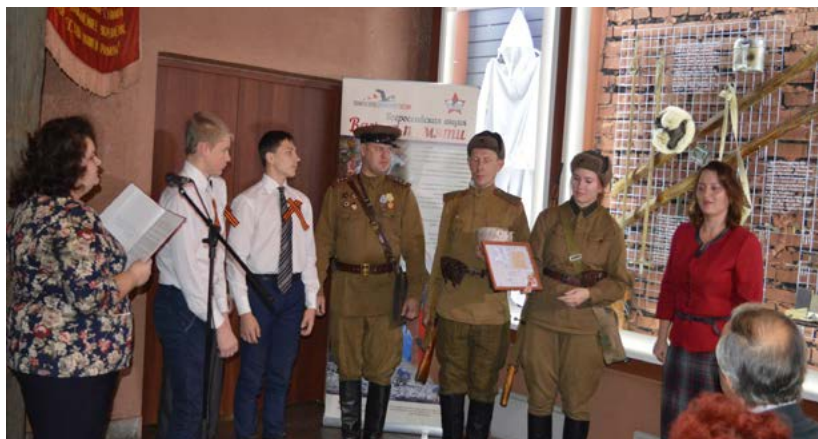
Фото 8. Вручение благодарственных писем волонтерам музея и членам КРОО «Красноярское общество любителей военной истории» на территории музея «Мемориал Победы»

Важным субъектом в сфере патриотического воспитания молодежи, помимо объединённой в организации активной общественности, могут стать и уникальные активисты. Для нас таким примером являются музейные волонтеры. Для реализации многих наших проектов требуется привлечение дополнительных партнеров (соорганизаторов), в этом случае волонтеры являются для нас большими помощниками.