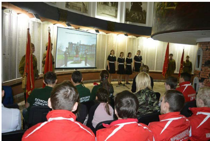
Фото 2. Мастер-класс для начинающих поисковиков по солдатской форме и снаряжению времен Великой Отечественной войны 1941—1945 гг., музей «Мемориал Победы», февраль 2018 г.

В качестве примера можно рассмотреть акции памяти, прошедшие в июне 2016, 2017, 2018 годов в разных местах г. Красноярска, связанных с историей участия красноярцев в Великой Отечественной войне 1941—1945 гг. Так, 22 июня 2016 года члены Красноярского общества любителей военной истории стали соорганизаторами и участниками торжественного заложения капсулы с землей, доставленной из мест захоронений павших в боях Великой Отечественной войны воинов-красноярцев под мемориалом пропавшим без вести солдатам. 22 июня 2017—2018 годов обмундированные в точные реплики униформы и снаряжения Рабоче-крестьянской Красной Армии начального периода войны, члены КРОО КОЛВИ стали соучастниками и соорганизаторами акции памяти на территории мемориального комплекса Поклонной горы г. Красноярска, создав уникальную историческую атмосферу во время памятных церемоний.